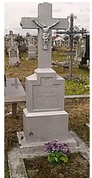
Могила Василя Сагайдака