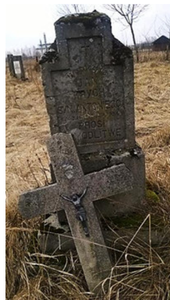
Могила Яна Криха. Цвинтар у Реклинці. Фото 2019 р.