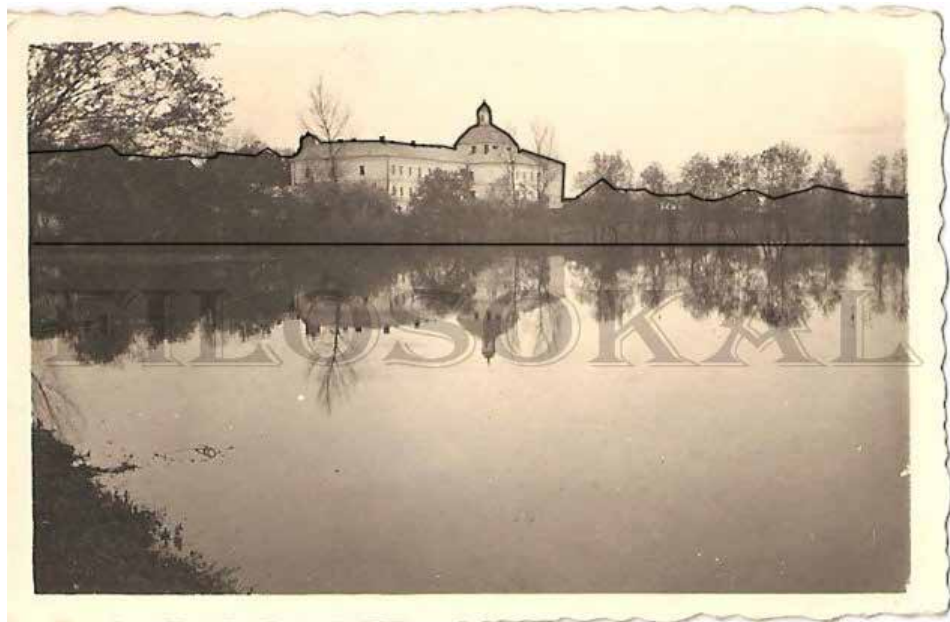
Рис. 3. Силует Василянського монастиря [5]