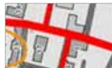
зв'язки, основні композиційні осі