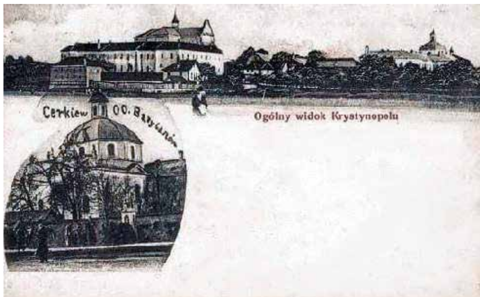
Рис. 2. Загальний вигляд Василянського монастиря і палацу Потоцьких у Кристинополі [5]